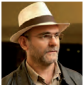
Celio Turino. Impulsor del programa Pontos de Cultura y ex secretario de Ciudadanía Cultural del Ministerio de Cultura, Brasil